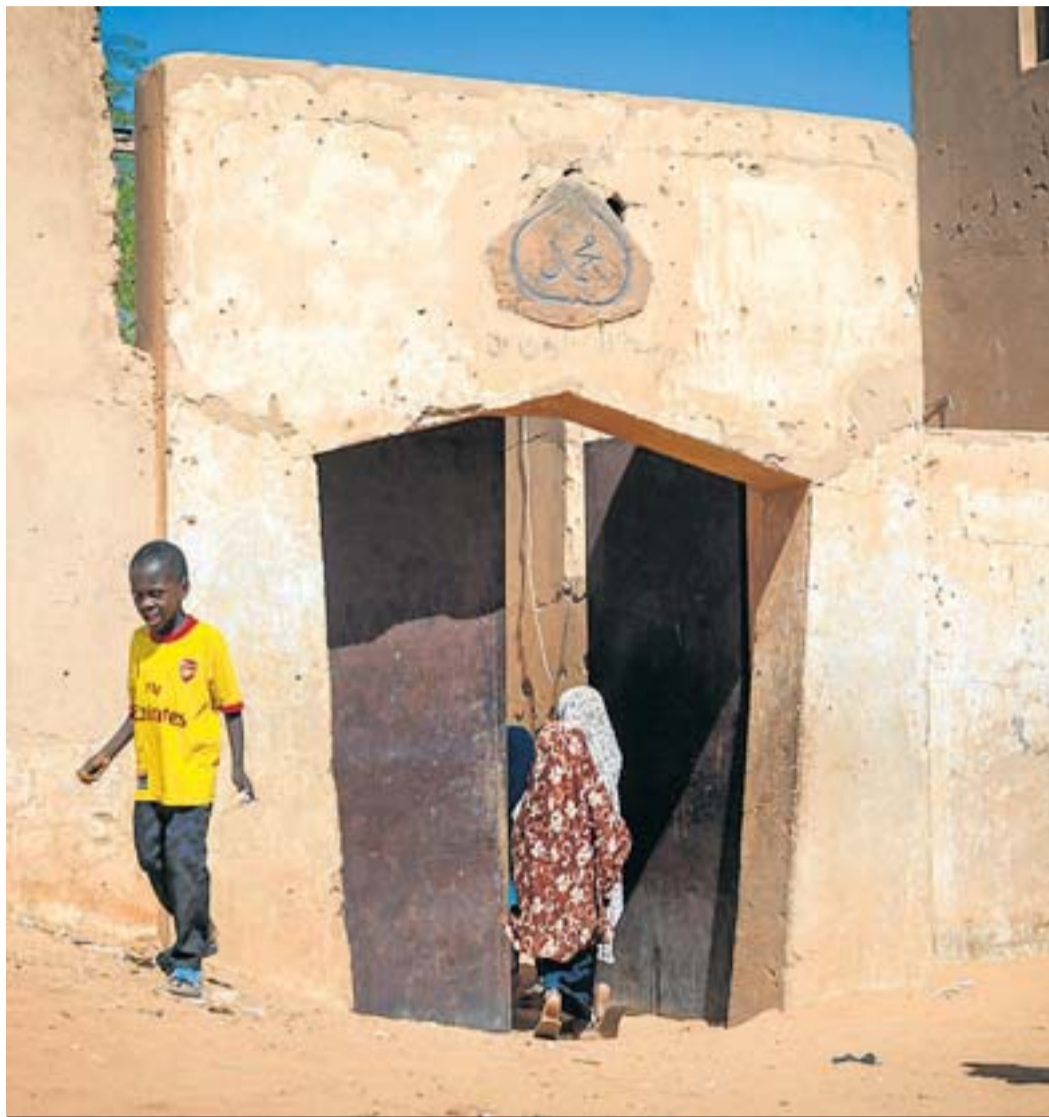
ARLIT, URANI I IMMIGRACIÓ Un grup de nens als afores d'una madrassa a Arlit. És la ciutat d'on van sortir els 92 immigrants morts de set al desert. Les mines de la ciutat donen una tercera part de l'urani que alimenta els reactors nuclears francesos. GEMMA PARELLADA

Els quatre francesos alliberats aquesta setmana van ser capturats